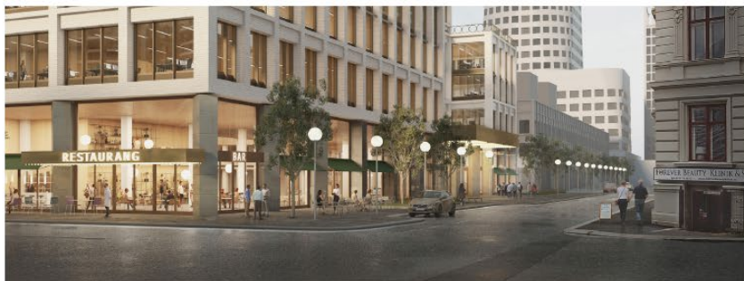
Smålandsgatan från Stureplatsen