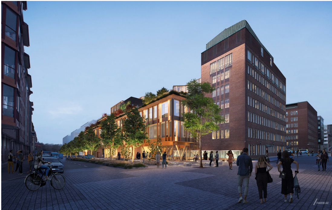
Platsbildning vid Smålandsgatans möte med Ernst Fontells Plats (Arkitema).

Smålandsgatan blir en stadsgata med mått, innehåll och utformning som ger en tydlig stadsmässighet. En trevligt planterad småskalig gatumiljö med omsorg om detaljer, material, belysning och påtaglig grönska ökar känslan av trivsel som förstärker tryggheten i området.