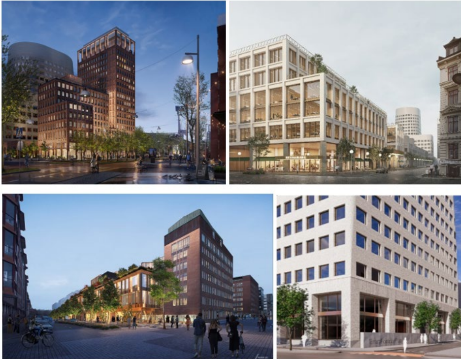
Illustrationer ovan t v Semrén Månsson ark, t h General Architecture/Kaminsky, nedan t v Arkitema, t h Wingårdhs