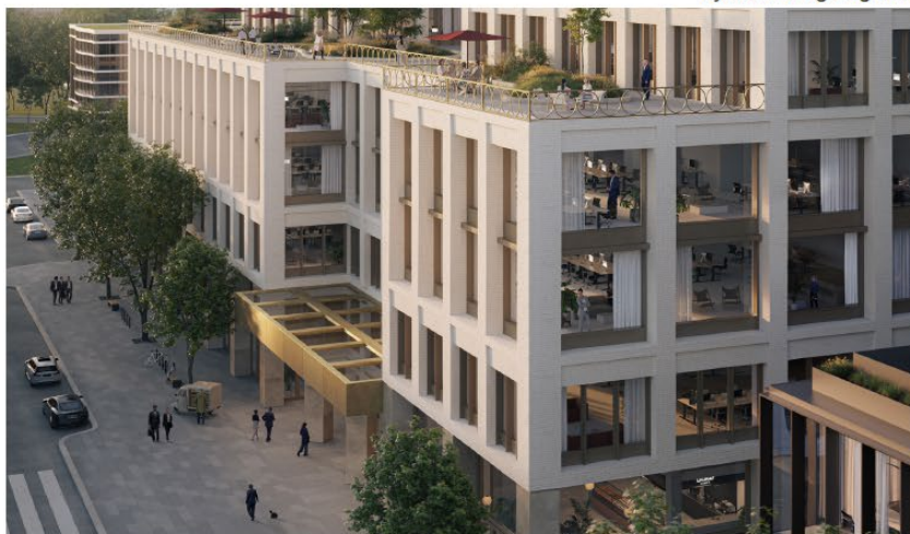
Smålandsgatan med kontorsentrén