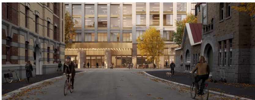
Vy från Västgötagatan